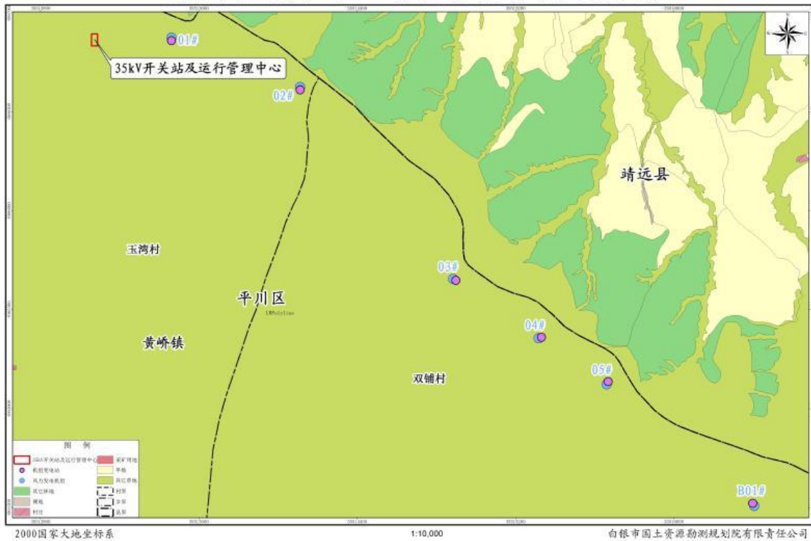
白银平川西格拉滩 20MW 分散式风电项目用地现状图